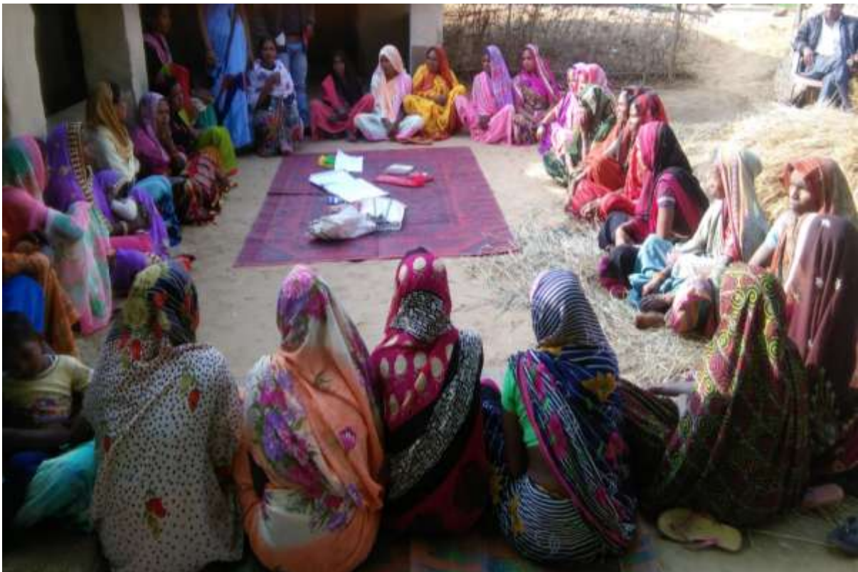
efgykvka ds I kFk I eg okrkl