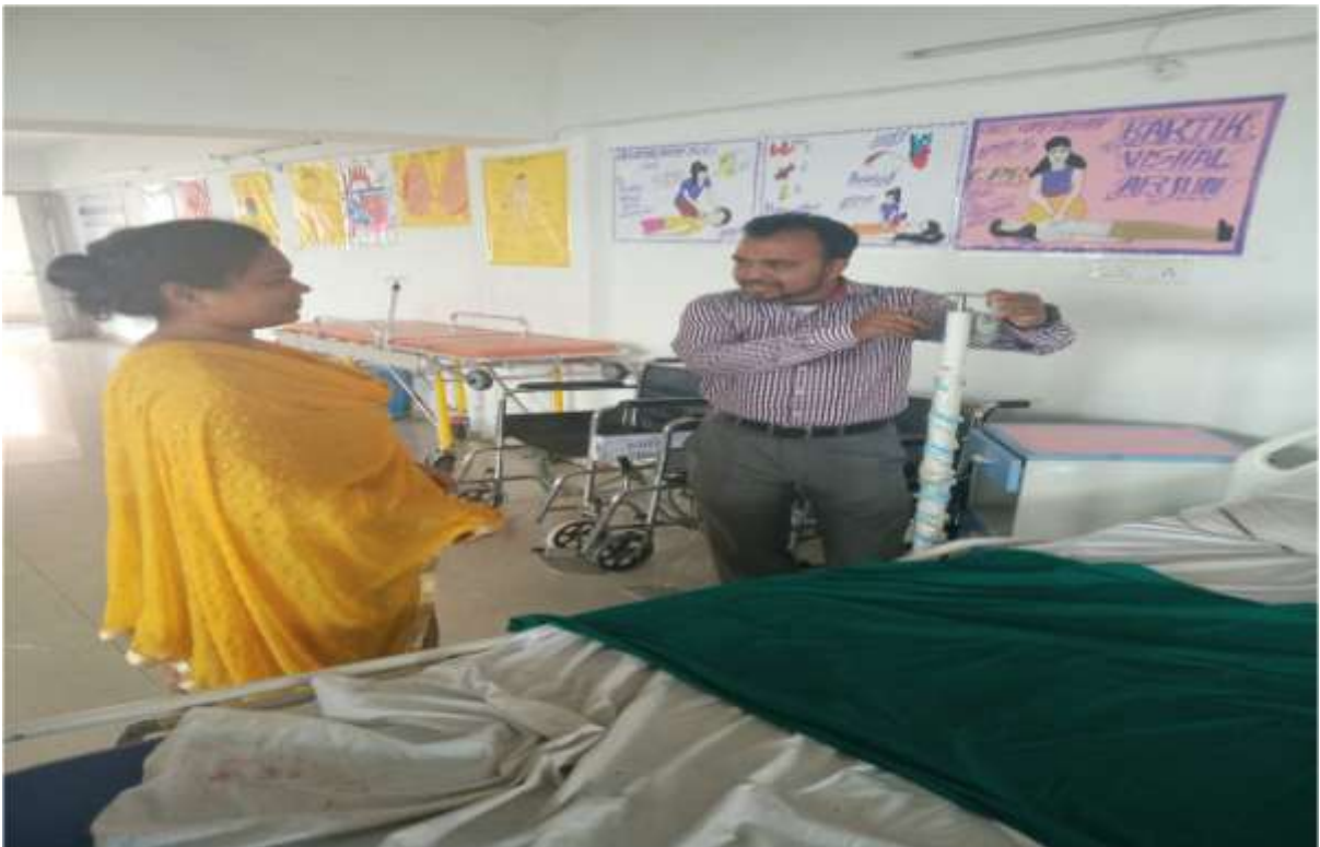
सेंटर का अवलोकन