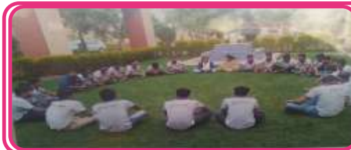
dfnz; I eg okrkZ (FGD)