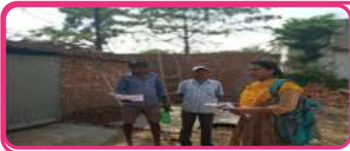
I k{kKRdj (Interview)

i fj; kst uk grq rF; dk I æg.k djus ds fy; s Community Based Participatory Research (CBPR) ds fuEufyf[kr 'kks/k rduhdka dk iz ksx fd; k x; k gš &