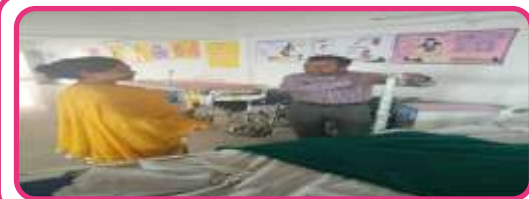
oš fDrd v/; ; u (Case Study)